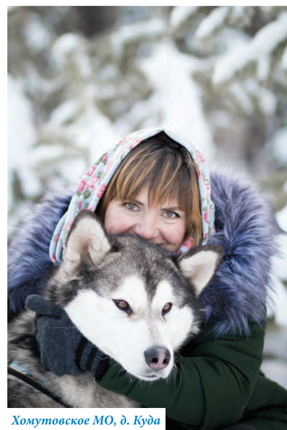
Хомутовское МО, д. Куда