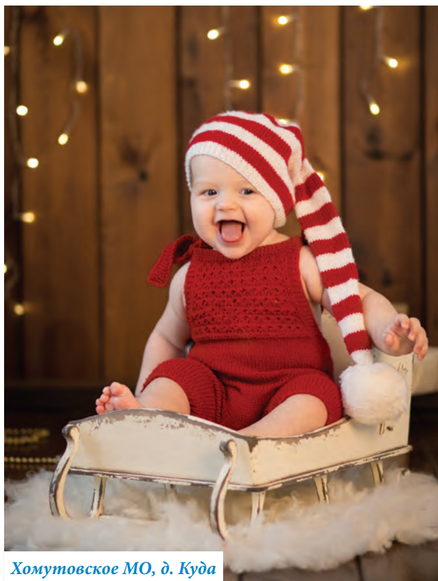
Хомутовское МО, д. Куда

В прошлом номере редакция газеты «Ангарские огни» объявила конкурс фотографий «Новогоднее настроение». Жителям Иркутского района идея понравилась, и мы уже начали получать первые снимки.