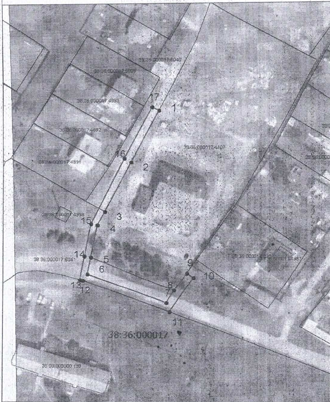
Схема границ публичного сервитута