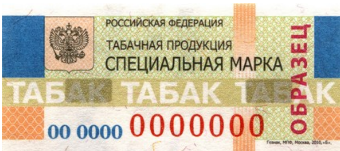
Специальная марка для всей российской табачной продукции.

На открытой витрине. В торговом зале можно разместить только перечень сигарет с ценами. Продавец может открыть витрину с табаком, только когда покупатель попросит об этом.