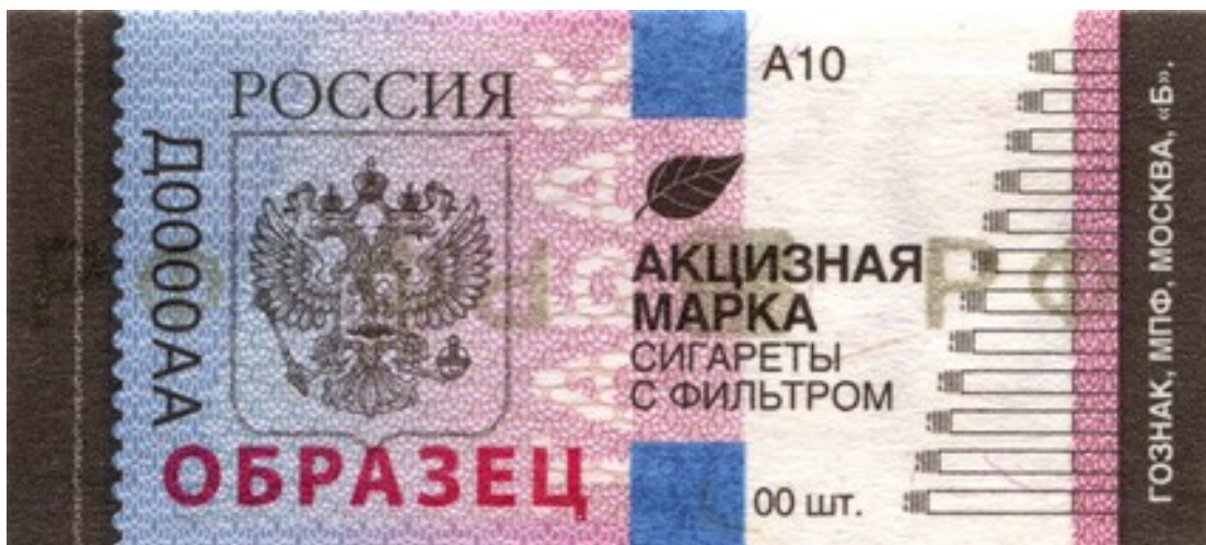
Акцизная марка для привозных (импортных) сигарет.

Без акцизных (специальных) марок. Производители сигарет сами закупают и приклеивают на пачки акцизные марки. Есть два вида марок: для местного и заграничного табака. На каждой указывают вид товара: сигареты с фильтром, сигары, сигариллы, табак трубочный. В момент приёмки товара предпринимателю нужно убедиться, что на пачках есть акцизные марки.